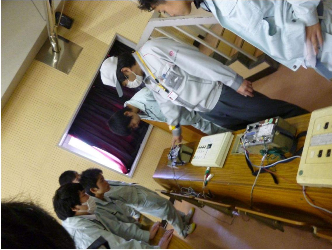
漏電遮断器動作試験 体験