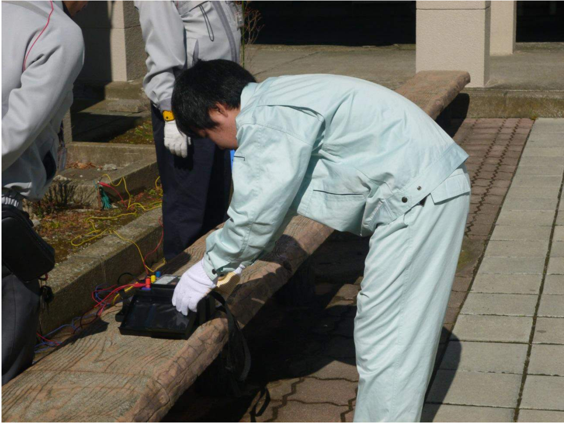
接地抵抗測定 実習