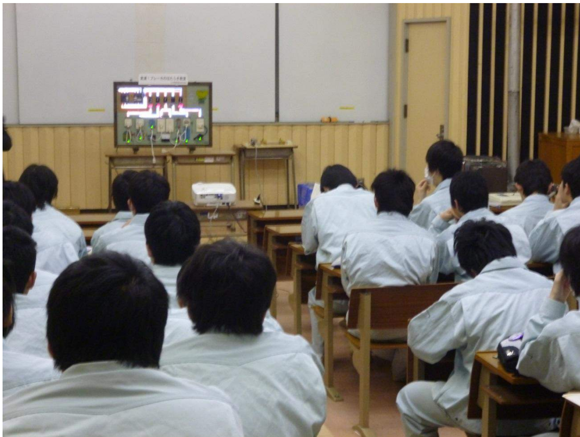
分電盤基礎知識 講義

今後は、「第一種電気工事士」資格取得につながる高圧電気設備に関する出前授業を計画しています。