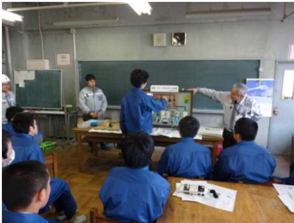
短絡・過負荷の実演 (どの機器が漏電しているか探してみよう・・・正解！)