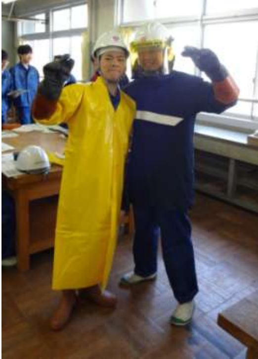
安全用具の着用体験 (結構重いね！)