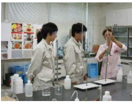
1年生も来年のために練習中