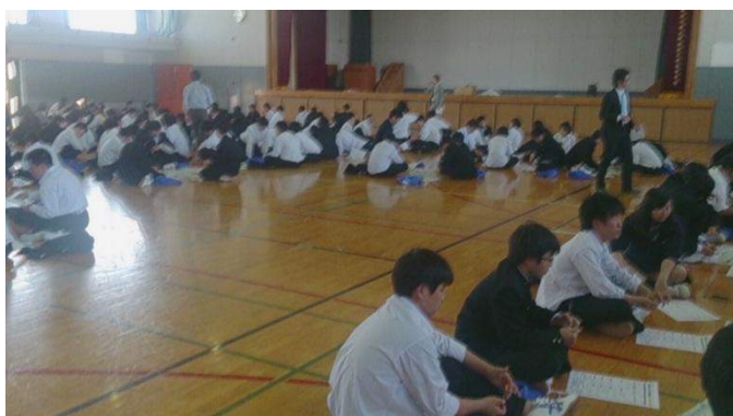
4 人の班に分かれ実施