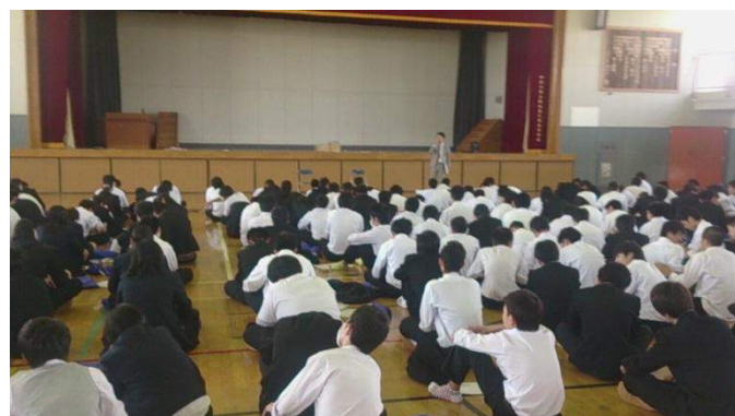
寸劇を鑑賞して「働く理由」を学びます

※ 1 「働き方と収入」：ゲームを通して生涯で稼げる額を勉強します。4 人のうち 2 人が正社員として働くことを想定し、2 人はフリーターとして働くことを想定し実施します。正社員とフリーターでは生涯賃金に大きな差がでることがわかります。