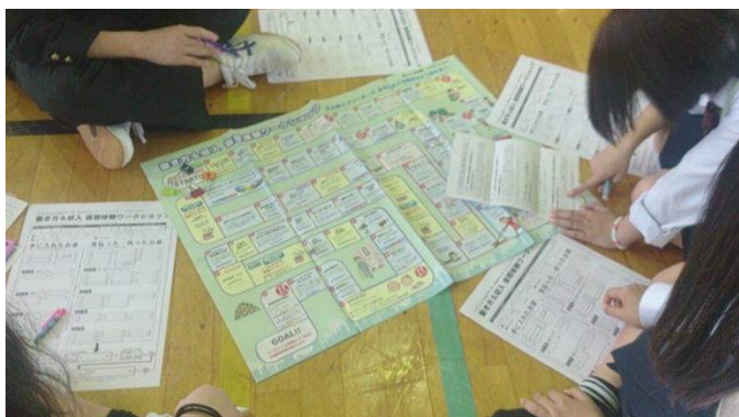
人生ゲームのようなすごろくで収入や支出を繰り返します。

1 年生の※ 1 「働き方と収入」についてのグループワークと※ 2 「働く目的と生きる意味」を考える寸劇を鑑賞しました。